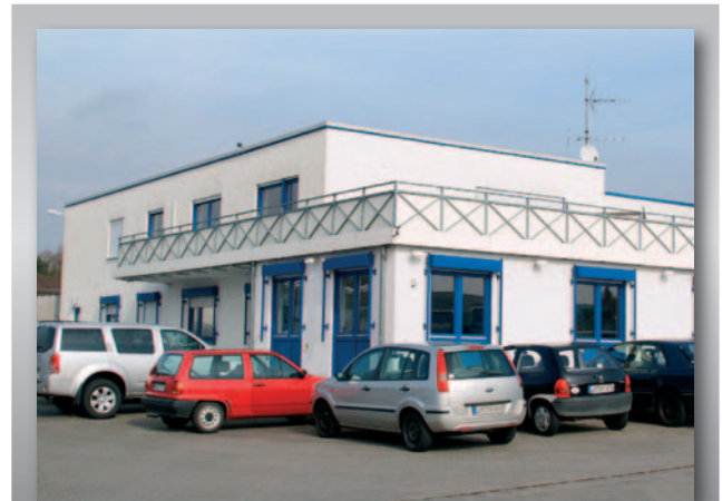
Am Stammsitz in Elz verfügt Stähler über eine Umschlagsfläche von 13.000 Quadratmetern.

Auch hier spielen die vom Fahrer übermittelten Auftragszustände eine große Rolle. Die Disponenten sehen mit einem Blick, welche Sendungen erfasst, disponiert, geladen und ausgeliefert sind beziehungsweise welche Touren bereits beendet wurden. In diesen Ablauf will Stähler zunehmend auch die Subunternehmer einbinden, die für das Unternehmen ständig fahren. Vor diesem Hintergrund hat Stähler das Modul „EasyTrack“ von BNS angeschafft, mit dessen Hilfe auf einfachste Art die Auftragszustände auf SMS-Basis per Handy übermittelt werden. Rund 70 Prozent aller Transportaufträge von Stähler werden von Subunternehmern erledigt.