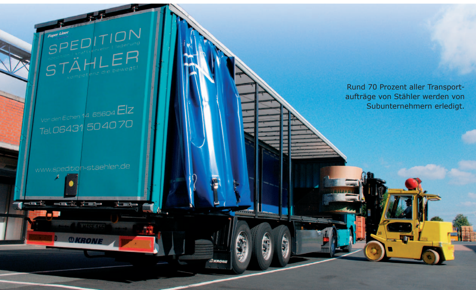
Rund 70 Prozent aller Transportaufträge von Stähler werden von Subunternehmern erledigt.