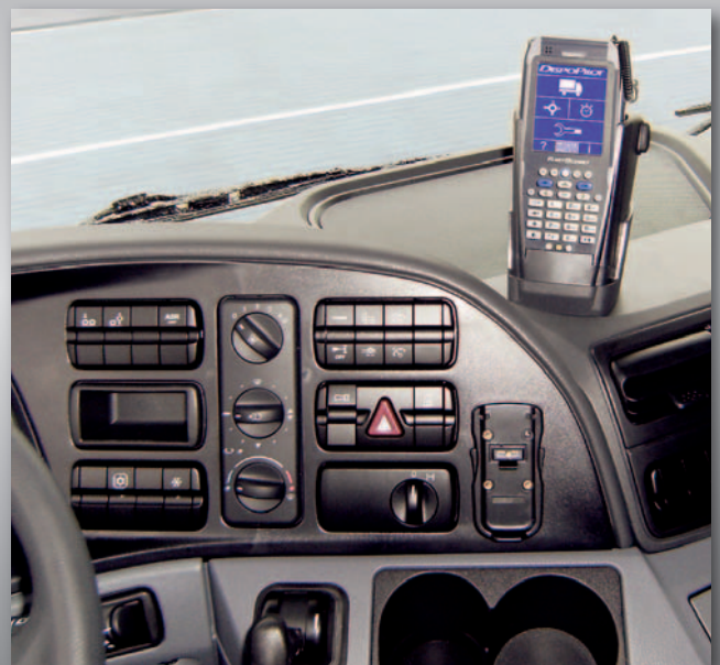
Auf Anhieb funktioniert hat auch die Schnittstelle von OnRoad zum Telematiksystem Fleetboard.