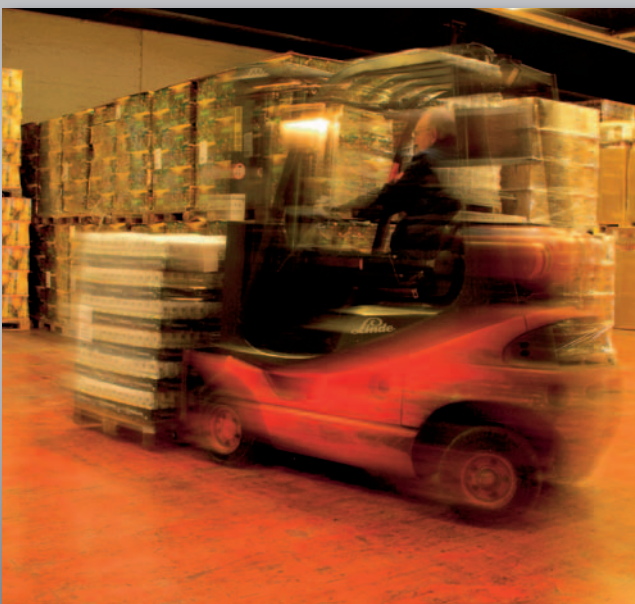
Alpha Logistik verfügt über eine durchgängige IT-Lösung von der Einlagerung bis zur Abrechnung.